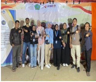
a. Festival Bandeng Asep 2023