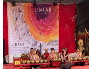
b. Penampilan Pelajar di Pameran Lukisan