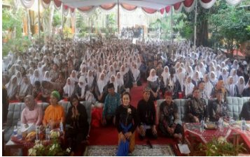
a. Even 1000 Warga Nembang Macapat

Sebagai bentuk konkret upaya menghadirkan pengalaman yang partisipatif dan kontekstual tersebut, Dakesda Sidoarjo melibatkan pelajar dan komunitas dalam berbagai agenda kebudayaan, antara lain: