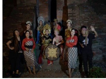
b. Photoshoot dan Cinematic Candi Dermo