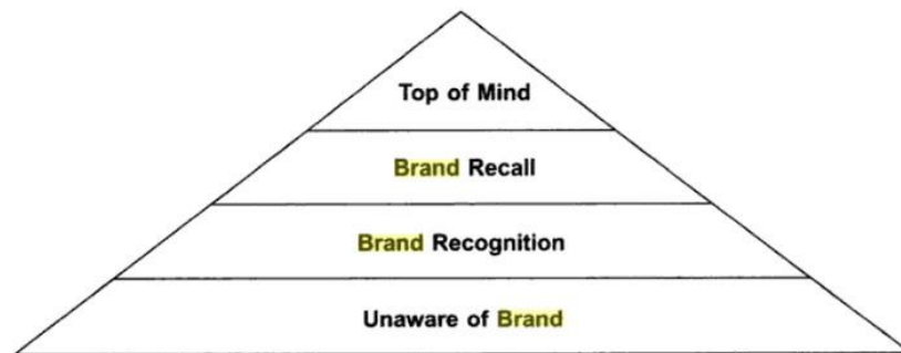
Gambar 2.3. Piramida Brand Awareness

Apabila seseorang bertanya secara langsung tanpa diberi bantuan pengingatan dan ia dapat menyebutkan suatu nama merek, maka merek yang paling banyak disebutkan pertama kali merupakan puncak pikiran. Dengan kata lain, merek tersebut merupakan merek utama dari berbagai merek yang ada dalam benak konsumen.