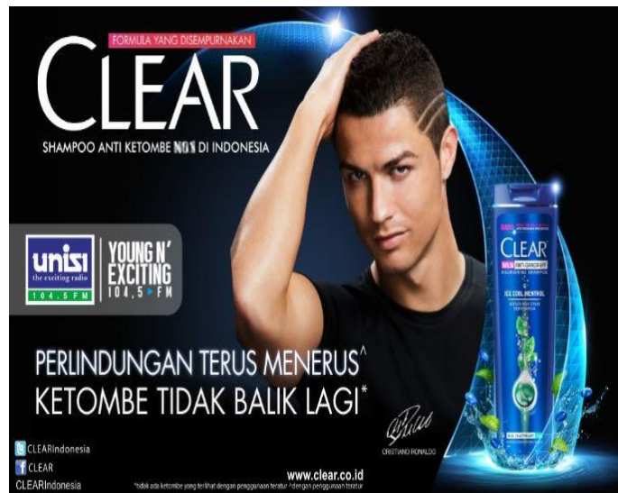
Contoh iklan shampo

Dapat dikemukakan bahwa pemasaran memfasilitasi proses pertukaran dan pengembangan hubungan dengan konsumen dengan cara mengamati secara cermat kebutuhan dan keinginan konsumen yang dilanjutkan dengan mengembangkan suatu produk ( product ) yang memuaskan kebutuhan konsumen dan menawarkan produk tersebut pada harga ( price ) tertentu serta mendistribusikannya agar tersedia di tempat-tempat ( place ) yang menjadi pasar produk yang bersangkutan. Untuk itu perlu dilaksanakan promosi ( promotion ) atau komunikasi guna menciptakan kesadaran dan