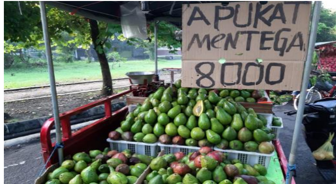
Gambar 1. Komunikasi Verbal Pemasaran

Komunikasi verbal melalui lisan dapat dilakukan dengan menggunakan media, elektronik seperti halnya iklan yang menggunakan audio visual. Sedangkan komunikasi verbal melalui tulisan dilakukan dengan secara tidak langsung antara komunikator dengan komunikan misalnya dalam penjualan langsung.