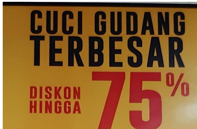
Gambar: contoh teks iklan verbal

Tata Bahasa di atas meliputi tiga unsur: fonologi, sintaktis dan semantik.