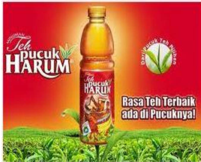
Contoh iklan Teh Pucuk Harum dengan slogan Rasa Teh Terbaik Ada di Pucuknya