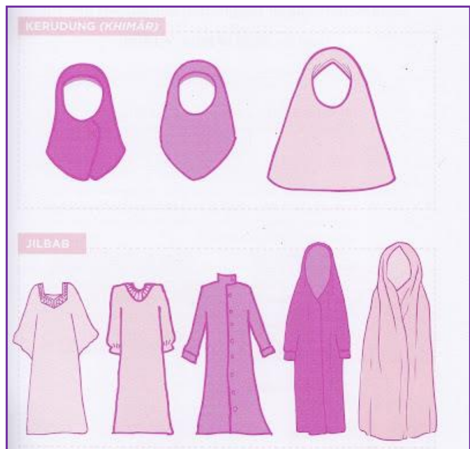
Gambar 3. 2 Ilustrasi Khimar dan Jilbab