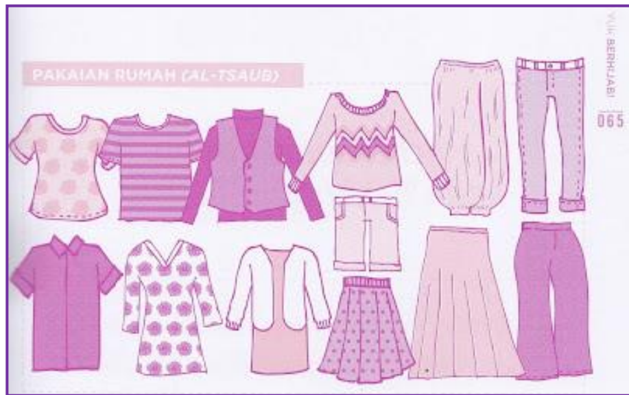
Sumber: Buku "Yuk Berhijab" karya Felix Y. Siauw Gambar 3.1 ustrasi pakaian rumahan (mihnah/ats-tsiyab)