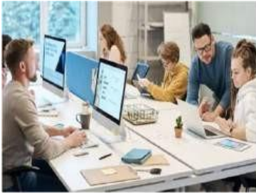
Gambar 4. 3 Lingkungan Pekerjaan yang Baik Menumbuhkan Kesejahteraan Karyawan

Dalam lingkungan pekerjaan yang baik, narasumber menjelaskan bahwa hal ini membuat mereka berada dalam sebuah kelompok dan dapat membantu mereka meringankan tekanan yang dirasakan dalam kondisi kerja medis.