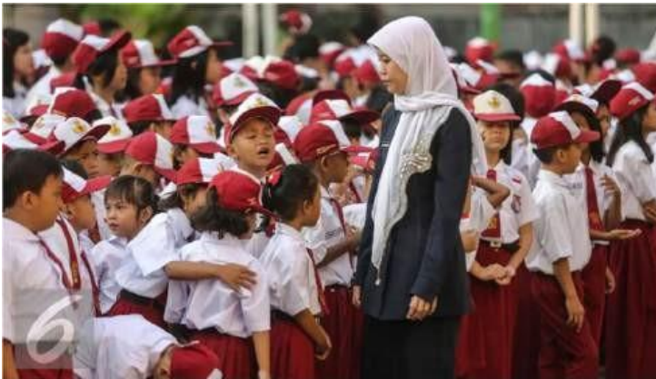
Gambar 1.5 Guru yang Harus menjadi Pendisiplin Bagi Murid-Muridnya

Hal ini menandakan bahwa lulusan-lulusan baru, terutama lulusan di bidang pendidikan memiliki minat yang rendah untuk menempuh karir sebagai guru, termasuk guru anak usia dini. Mengapa demikian? Profesi menjadi guru, terutama guru anak usia dini merupakan salah satu profesi dengan tingkat stress tertinggi menurut