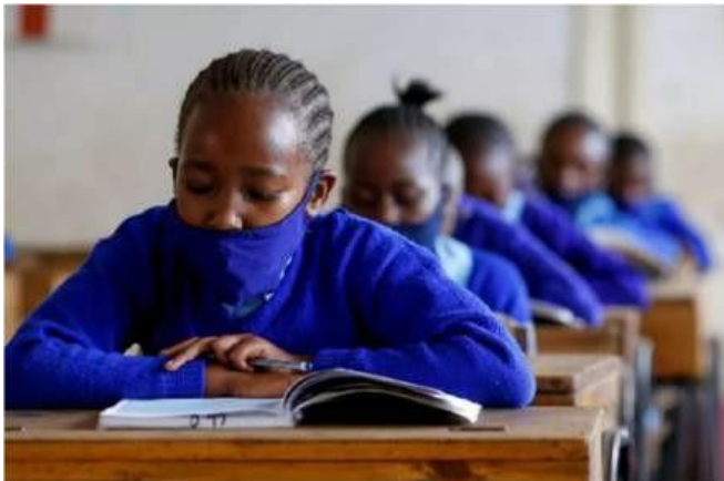
Gambar 4. 6 Covid 19 sebagai Salah Satu Bentuk Tekanan Sekaligus Tantangan Kepada Guru & Pengajar Untuk Beradaptasi Pada Perubahan Keadaan

berpengaruh kepada Occupational Well-Being dari pekerja tersebut yang dalam penelitian tersebut. Hal tersebut dinilai Stang-Rabrig dan koleganya penting tidak hanya pada situasi COVID-19 pada waktu itu, namun juga kepada beberapa tantangan di masa depan yang mungkin akan muncul. Mereka mengatakan bahwa kompetensi dari guru harus ditingkatkan untuk menyiapkan guru untuk dapat melakukan coping . Kompetensi tersebut tidak hanya berkaitan dengan kompetensi untuk bekerja saja, namun menariknya mereka mengatakan bahwa kompetensi personal atau pribadi juga harus ditingkatkan dan memiliki kedudukan yang sama penting dengan kompetensi pekerjaan. Beberapa kompetensi personal yang disebutkan dalam penelitian Stang-Rabrig adalah readiness to innovate dan juga self efficacy .