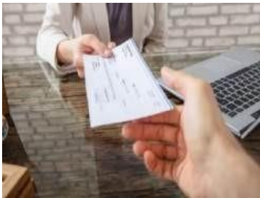
Gambar 4. 5 Gaji sebagai Salah Satu Penentu Occupational Well-being

memiliki pandangan yang baik akan pekerjaannya. Narasumber juga mengatakan bahwa mereka mendapatkan bayaran konsisten dengan pekerjaan yang mereka lakukan.