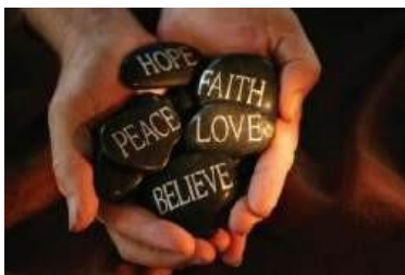
Gambar 4. 7 Ilustrasi Keterkaitan Religiusitas dengan Kesehatan Mental dan Kesejahteraan Individu

Sebagian orang percaya bahwa memiliki prinsip dan kepercayaan yang kokoh dalam hidup akan sangat membantu seseorang dalam menjalani kehidupan sehari-harinya. Agama adalah salah satu kepercayaan yang dapat mengatur cara berpikir dan juga cara seseorang untuk dapat berperilaku. Seseorang yang taat dan patuh dalam menjalankan perintah agama yang dipercayai biasanya disebut sebagai orang yang religius atau memiliki religiusitas yang tinggi.