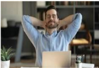
Gambar 4. 8 Ilustrasi Pekerja yang Mencoba Untuk Menerapkan Mindfulness

Dimensi ini berkaitan dengan pemahaman seseorang bahwa hal atau pengalaman bukanlah sebuah hal yang absolut dan akan berlalu, sekaligus pula tidak cukup untuk menggambarkan diri seseorang berdasarkan satu pengalaman tersebut. Dimensi ini menjelaskan kesadaran seseorang bahwa pengalaman yang dia alami bukanlah hal yang akan terjadi secara terus menerus namun akan memiliki akhir, dan bukan realita dari diri individu tersebut secara keseluruhan.