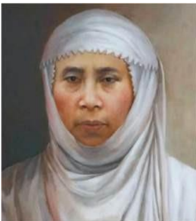
Gambar 2. 2 Foto Resmi Siti Walidah

Organisasi Aisyiyah sendiri berdiri pada tahun 1917 yang didirikan oleh pendiri Muhammadiyah K.H Ahmad Dahlan dan Siti Walidah. Organisasi ini berdiri berdasarkan landasan pemikiran kelompok wanita pada waktu itu yang merasa bahwa wanita juga memiliki peran dalam