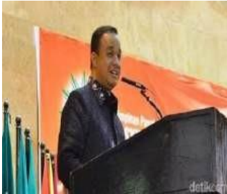
Gambar 2. 4 Ucapan Apresiasi Anies Baswedan Kepada Asyiyah Tahun 2015

Aisyiyah memilih pendidikan dan perlindungan wanita serta keluarga sebagai sasaran utama amal karena dianggap relevan dengan kebutuhan masyarakat dalam segala kondisi. Sebagai salah satu organisasi keagamaan terbesar di Indonesia, Aisyiyah memiliki visi terkait pengembangan aspek dakwah dan pendidikan Islam. Visi ini dirancang oleh pimpinan agar gerakan dakwah dan pendidikan keislaman yang dilakukan Aisyiyah berjalan efektif dalam membangun dan memberdayakan masyarakat Indonesia (Nisa, 2022).