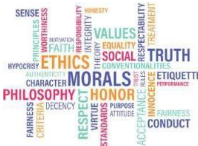
Gambar 4. 2 Beberapa Value Pekerjaan yang Dapat Mempengaruhi Persepsi Individu Pada Pekerjaannya

Ekspetasi karir merujuk pada ekspetasi yang dimiliki oleh narasumber terkait pekerjaan yang dia kerjakan. Pada penelitian tersebut dijelaskan bahwa ekspetasi dari tiap narasumber bermacam-macam dan bergantung dengan value individual yang dimiliki oleh seorang individu. Peneliti juga menekankan bahwa ekspetasi yang tepat berperan secara