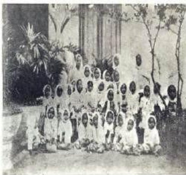
Gambar 2. 3 Murid-Murid Pertama TK Busthanul Athfal

Aisyiyah sebagai organisasi otonom dalam Muhammadiyah ditetapkan melalui surat keputusan PP Muhammadiyah No.1/66. Ortom berfungsi sebagai satu kesatuan organisasi Muhammadiyah untuk mencapai tujuan Muhammadiyah, yaitu menegakkan dan menjunjung tinggi agama Islam sehingga terwujud masyarakat Islam yang sebenar-benarnya. Organisasi Aisyiyah dipimpin oleh istri KH Ahmad Dahlan, yaitu Nyai Siti Walidah. Sebelum Aisyiyah berdiri, di kalangan wanita muslim Muhammadiyah sudah banyak kegiatan yang dipelopori oleh Siti Walidah,