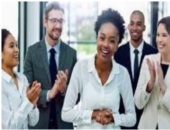
Gambar 4. 1 Ilustrasi Pekerja yang di Apresiasi Rekan-Rekannya

Hal ini berkaitan dengan pengakuan yang didapatkan oleh narasumber terkait pekerjaannya yang bersumber dari orang lain. Peneliti mengatakan bahwa pengakuan adalah salah satu kata yang paling sering di transkribkan dalam wawancara yang dilakukan. Narasumbers juga mengatakan bahwa mereka merasakan kepuasan dan juga kebahagiaan dari pekerjaan mereka ketika mereka dipuji oleh rekan kerja, anggota keluarga, atasan, dan terutama dari pasien yang mereka tangani.