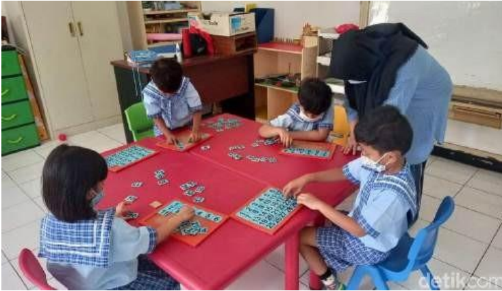
Gambar 1. 2 Proses Pembelajaran PAUD.

Pendidikan anak usia dini di Indonesia sendiri terus mengalami perkembangan meskipun sempat mengalami hambatan pada tahun 1965 akibat peristiwa G30S/PKI yang berdampak kepada seluruh bidang negara. Namun ketika era orde baru pendidikan anak usia dini kembali mengalami perkembangan hingga sampai di era reformasi dimana kualitas dari pendidikan anak usia dini sangat diperhatikan dengan tenaga pengajar atau guru dari anak usia dini harus memiliki kompetensi minimum Diploma Dua dan diadakannya pendidikan guru PAUD pada jenjang perguruan tinggi. Hal ini menandakan komitmen yang tinggi dari seluruh pihak untuk memastikan pendidikan anak usia dini yang berkualitas di Indonesia.