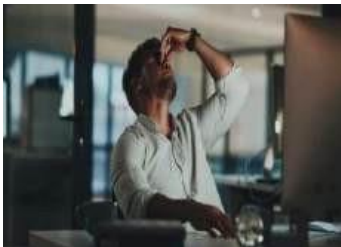
Gambar 3. 3 Ilustrasi Pekerja yang Stress Menghadapi Tuntutan Kerja

3 Aspek tersebut selanjutnya menjadi dasar pengukuran atribut Occupational Well-Being yang disebut dengan tripartite Occupational Well-Being scale .