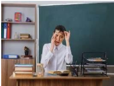
Gambar 1. 3 Ilustrasi Guru yang Tertekan Secara Psikologis

karena stress berlebih dari berbagai sumber, termasuk profesi mengajar itu sendiri.