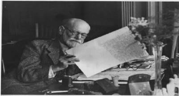
Gambar 3. 1 Sigmund Freund, Salah Satu Tokoh Awal Psikologi yang Terkenal dengan Pemikirannya Mengenai Psikopatologi

Percaya atau tidak, manusia pernah mencapai titik terendah tersebut.