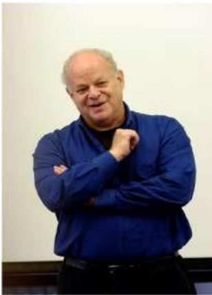
Gambar 3. 2 Martin Seligman, Terkenal sebagai Pengganggu Psikologi Positif dan karena Kajiannya Mengenai Happiness dan Well-being

Psikologi positif sendiri didefinisikan sebagai sebuah studi saintifik mengenai kekuatan dan juga kebaikan yang dapat membuat sebuah individu atau komunitas bertumbuh dengan baik. Bidang kajian psikologi ini didasari pada kepercayaan dimana individu ingin menjalani kehidupan yang bermakna, utuh, serta memunculkan apa yang terbaik dari diri mereka, dan meningkatkan pengalaman yang dihasilkan dari proses kehidupan. Kajian ini sangat berbanding terbalik dengan kajian psikologi yang sebelumnya yang berfokus pada gangguan dan penyakit mental manusia. Kajian ini lebih berfokus pada bagaimana caranya mencegah munculnya