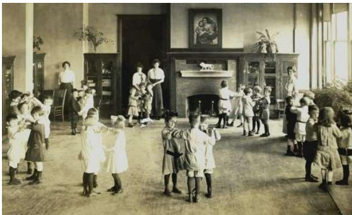
Gambar 1. 1 Taman Kanak-Kanak Zaman Hindia Belanda.

Pada era jepang, meskipun tidak ada diskriminasi yang dilakukan oleh kekaisaran Jepang untuk pendidikan masyarakat Indonesia, namun dalam praktiknya jepang banyak menyisipkan paham dan ideologi kepada pendidikan anak usia dini yang dikenal dengan sistem “ Taman Kanak-kanak Nippon ”. Hal ini tentunya membuat kualitas pendidikan khususnya pendidikan anak usia dini di Indonesia mengalami krisis identitas, Sehingga ketika jepang mengalami kekalahan Perang Dunia II dan Indonesia akhirnya telah mencapai kemerdekaannya, maka pemerintah Indonesia memberikan perhatian dan penekanan kepada perkembangan pendidikan masyarakat, dan mengakui pendidikan anak usia dini dan taman kanak-kanak sebagai salah satu komponen penting dalam pendidikan Indonesia yang diatur dalam undang-undang no 4 tahun 1950 mengenai pendidikan dan pengajaran.