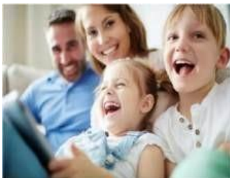
Gambar 4. 4 Dukungan Keluarga sebagai Salah Satu Faktor Occupational Well-Being

Narasumber yang sebagian besar telah memiliki keluarga menjelaskan bahwa dukungan dari keluarga memberikan pengaruh besar kepada pekerjaan mereka. Narasumber juga mengatakan bahwa mereka