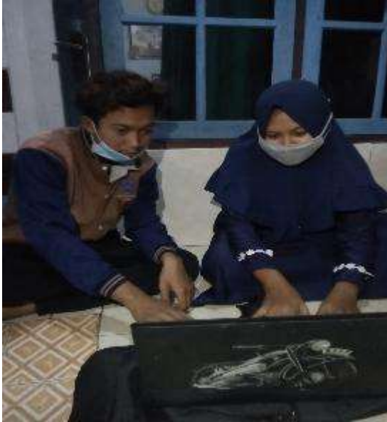
Gambar 23. Mengenalkan Sosial Media Kepada Target

Untuk program kedua ini kami mengajarkan tentang pemasaran online atau digital marketing terhadap owner jamur tiram, pertama dengan cara mengenalkan media internet yaitu facebook dan instagram, lalu kami memberi panduan atau pendampingan cara menggunakan aplikasi online dengan cara membuat akun facebook dan instagram, kemudian mengajarkan cara penggunaan media tersebut mulai dari log in akun, upload foto dan memberi tahu jika ada pembeli produknya.