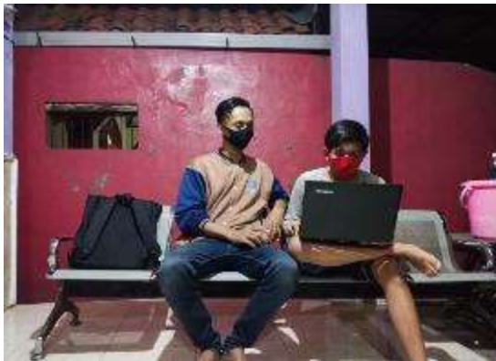
Gambar 14. Proses Pelatihan Ms.PowerPoint

Program ini berjalan dimulai dari pelatihan untuk mengoperasikan dasar-dasar dari aplikasi Ms.word. Pada tahap awal fokus kepada penguasaan mengoperasikan Ms.word sehingga pencapaian luaran dari penguasaan Ms.Word ini sangat bervariasi. Tahap selanjutnya yaitu dengan mulai pembuatan cerpen yang berisikan profil target. Timeline yang kami gunakan telah dibagi dalam 2 garis besar program, yaitu untuk penguasaan Ms.word di 2 minggu pertama, sedangkan untuk pelatihan Ms.PowerPiont pada 2 minggu kedua kegiatan kami 1 bulan untuk target saudara Bintang dan 1 bulan sisanya dengan Saudara Malik.