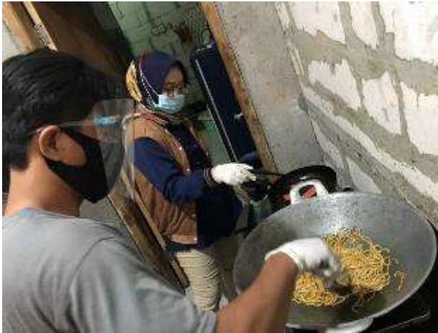
Gambar 19. Membantu proses produksi Mie Kalab

pesanan yang melalui kami pribadi. Dalam kegiatan ini kami juga membantu proses produksi mie kalab pada saat banyak pesanan dari aplikasi gojek.