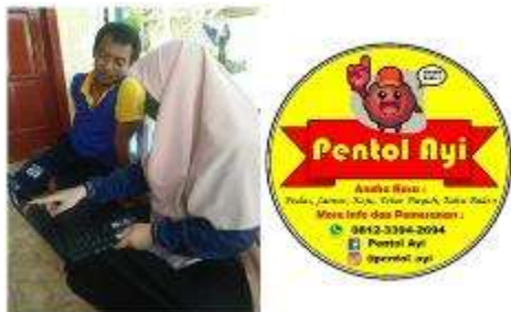
Gambar 4. Pembuatan logo produk

Branding berperan penting terutama dalam hal membuat produk yang kita jual bisa dengan mudah dikenali masyarakat. Bahkan memudahkan kita dalam hal pemasaran produk. Oleh karena itu, kami melakukan kegiatan pendampingan dan pelatihan branding produk Pentol Ayi agar mudah dikenali masyarakat. Kami melakukan pendampingan dalam pembuatan logo produk serta membantu pembuatan stiker untuk label kemasan agar menarik. Logo tersebut juga kami gunakan untuk mempromosikan produk Pentol Ayi di media sosial Instagram.