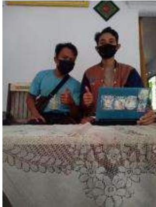
Gambar 7. Pemasaran online

Melakukan pemasaran online lewat facebook , instagram dan whatsapp ternyata peminat paling banyak di Facebook karena banyak grup ikan hias disitu kami mencoba memasarkan produk. Dimasa pandemi yang serba dibatasi seperti ini kami berfikir untuk membuka layanan kirim cepat sampai lokasi dengan ongkos kirim sesuai jarak jauh dekat lokasi tujuan.