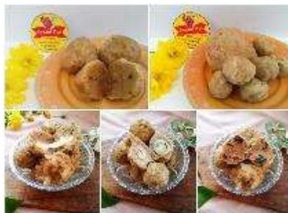
Gambar 2. Pentol Aneka Rasa

Melakukan inovasi pada suatu produk memang diperlukan agar konsumen tidak merasa bosan dengan jenis produk yang itu-itu saja. Dalam hal ini, kami melakukan pendampingan dan pelatihan dalam Inovasi Produk UMKM “Pentol Ayi” milik Pak Kholiq yaitu salah satu warga di Desa Ketegan RT 03 RW 02 Tanggulangin Sidoarjo. Kami menambahkan berbagai macam varian rasa pada produk Pentol Ayi yaitu, pentol jamur, pentol keju, pentol puyuh, dan pentol pedas.