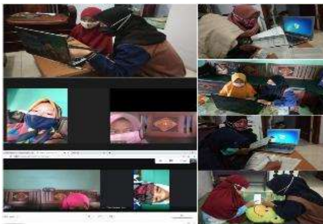
Gambar 25. Kegiatan Pendampingan

Kegiatan KKN tahun 2020 ini sangat berbeda dari tahun sebelumnya karena dilakukan secara daring. Seluruh aktivitas yang dilakukan Semuanya serba online . Setelah kami melakukan servasi di sekitar Ternyata banyak yang kesulitan terutama orang tua target. pada minggu pertama kami melakukan survei di beberapa tempat dan menemukan orang tua yang antusias dengan adanya KKN ini. mereka sangat setuju dengan adanya kegiatan karena merasa terbantu untuk anaknya didampingi. setelah itu kami melakukan diskusi bersama kelompok mengenai kegiatan log book KKN. masuk minggu kedua kami mendatangi rumah target pertama kami yang bernama Talita sanchia. Talita merupakan siswi yang duduk di bangku kelas 6 SD dia merasa kesulitan dengan tugas yang diberikan oleh guru dalam menjawab kuis melalui Google form. disini kami mendampingi serta melatih Bagaimana cara menggunakan Google form. masuk minggu ke-3 kami mengajar dan mendampingi Bagaimana cara mencari referensi poster mengenai lingkungan di Google. disini kami mengajarkan bagaimana cara mendownload gambar yang ada di Google. masuk minggu ke-4 kami mendampingi dalam mengerjakan soal tematik.