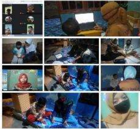
Gambar 1. Foto Kegiatan Pendampingan belajar online