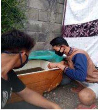
Gambar 5. Menyimpan stok kutir

Mencoba menyimpan stok kutu air dalam jangka panjang sudah berhasil, berikutnya dengan mencoba breeding kutu air agar tidak selalu mencari ke alam liar karna musim tidaklah selalu pasti apalagi dimusim kemarau saat ini.