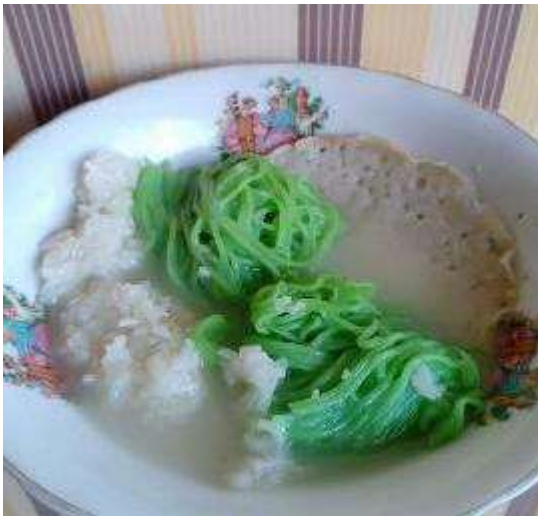
Gambar 17. Serabi Petulo Jajanan Ndeso

Usaha Mikro Kecil dan Menengah (UMKM) adalah salah satu bentuk mata pencaharian untuk seseorang yang ingin berusaha sendiri atau tidak ingin bekerja di bawah tekanan orang lain. Serabi petulo adalah salah satu jenis makanan yang sudah terlahir dari sejak puluhan tahun yang lalu. Serabi petulo juga termasuk dalam kategori jajanan ndeso, meskipun jajanan ndeso serabi petulo adalah jajanan yang banyak penggemarnya baik dari kalangan muda maupun tua. Akhir-akhir ini serabi petulo sangat jarang sekali untuk di jumpai, apalagi jika berada dalam kategori masyarakat perkotaan. Beruntungnya kalian jika masih bisa menjumpai jajanan tempo dulu tersebut. Kami mengembangkan UMKM serabi petulo tersebut dengan cara memperkenalkan pentingnya digital marketing untuk peningkatan penjualan, karena menurut Andi (2019), digital marketing memiliki pengaruh kuat terhadap peningkatan kinerja produk UMKM.