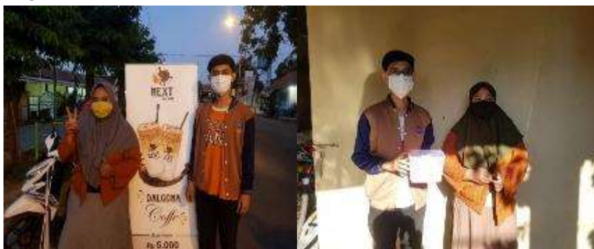
Gambar 9. Pendampingan UMKM

Disamping itu, munculnya dalgona ini semenjak viral hanya memiliki 1 varian rasa yakni kopi. Hal ini, memberikan kesempatan kami dalam melaksanakan program kerja yakni memberikan penyuluhan/pelatihan dengan inovasi rasa baru yakni rasa strawberry dan green tea.