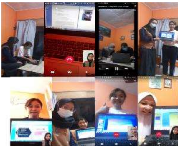
Gambar 12. Pelatihan Pendampingan MS. Office

foto, video, dan mengenalkan sistem operasi sebagaimana untuk pengetahuan tugasnya. Serta mengenalkan fungsi fitur-fitur yang ada dalam Microsoft word lainnya. Setelah itu, memperkenalkan Microsoft power poin, dimana target tidak banyak mengenal dan tidak banyak menggunakan Microsoft power point di sekolahnya. Pendampingan pembelajaran Microsoft power point seperti cara memasukkan foto dan video kedalam Microsoft power point, cara mendownload background template dan memasukkan kedalam Microsoft power point, pemberian efek kedalam slide Microsoft power point, pemberian music, serta cara memasukkan dan membuat tabel kedalam slide Microsoft power point dan memberikan pembelajaran pada slide untuk berjalan secara otomatis. Berikut adalah foto pendampingan dan pembelajaran Microsoft office.