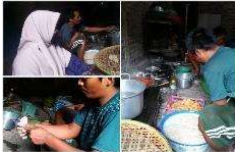
Gambar 3. Pendampingan pembuatan pentol aneka rasa

Kegiatan ini kami awali dengan menunjukkan cara pembuatan pentol aneka rasa via Youtube. Kami menunjukkan beberapa video tutorial pembuatan pentol aneka rasa seperti pentol jamur, pentol keju, pentol pedas, dan pentol puyuh. Untuk kegiatan selanjutnya kami melakukan pendampingan pembuatan pentol aneka rasa. Dengan adanya inovasi pada produk ini, para customer memberikan tanggapan positif karena produk Pentol Ayi semakin bervariasi.