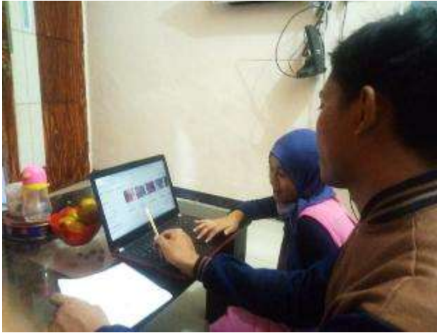
Gambar 10. Proses Pemilihan Supplier di Indotrading

Program ini berjalan dimulai dari pelatihan untuk menemukan supplier baru hingga membuat toko pada online shop Bukalapak. Pada tahap awal fokus kepada pencarian supplier makanan yang baru sehingga produk yang dijual pun semakin bervariasi. Tahap selanjutnya yaitu dengan mulai merambah ke digital marketing melalui Bukalapak. Timeline yang kami gunakan telah dibagi dalam 2 garis besar program, yaitu untuk pencarian supplier baru di 4 minggu pertama, sedangkan untuk pemasaran melalui digital marketing dilakukan di 4 minggu kedua.