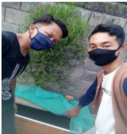
Gambar 5. Hasil pembuatan kolam

Usaha kecil hampir tidak berjalan dikala pandemi yang serba dibatasi, usaha penjual pakan hidup biasa disebut kutir (kutir) untuk pakan ikan hias sangat merasakan kerugian karena yang dijual pakan hidup dalam jangka 4 hari saja jika tidak terjual untuk pakan maka kutir tersebut akan mati, dan sempat untuk menutup usahanya, lalu kami memberikan solusi dengan membuat kolam kecil tepatnya dibelakang rumah untuk melakukan breeding kutir tersebut dengan mengikuti tata cara di youtube agar lebih mudah untuk menampung stok pakan dalam waktu lebih panjang bahkan bisa berkembang biak.