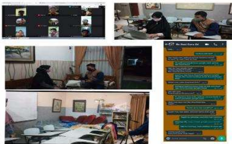
Gambar 24. Pendampingan Penggunaan Media Belajar Online

Kuliah Kerja Nyata (KKN) 2020 dilaksanakan dengan sedikit berbeda dari biasanya. Dikarenakan adanya pandemi covid-19 ini, Kuliah Kerja Nyata (KKN) 2020 dilakukan di wilayah domisili masing-masing. Program kerja yang kami pilih dalam KKN ini adalah Pendidikan yang berupa pendampingan penggunaan media belajar online . Pada program ini kami memiliki dua target yaitu guru SD dan siswa kelas 6 SD, untuk mengetahui apa masalah yang telah dihadapi atau kesulitan apa dalam melaksanakan pembelajaran daring kami melakukan survey langsung. Ternyata target kami kesulitan dalam menggunakan atau mengoperasikan media belajar online (Zoom).