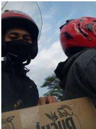
Gambar 8. Kirim kutir

Melakukan pemasaran online lewat facebook , instagram dan whatsapp ternyata peminat paling banyak di Facebook karena banyak grup ikan hias disitu kami mencoba memasarkan produk. Dimasa pandemi yang serba dibatasi seperti ini kami berfikir untuk membuka layanan kirim cepat sampai lokasi dengan ongkos kirim sesuai jarak jauh dekat lokasi tujuan.