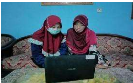
Gambar 27. Inovasi UMKM

Dalam hal ini menginovasi produk pada kemasan yang semula tidak ada Branding produk , sekarang menggunakan Branding produk, dengan ini supaya dapat mprok mempunyai keunikan tersendiri dari rasa atau kemasana dan dapat menarik pelanggan dan pemasaran online tidak hanya dilakukan disekitar lingkungan tetapi bisa dilakukan dengan pemasaran online melaui WhatsApps, Intragram, dan Facebook.