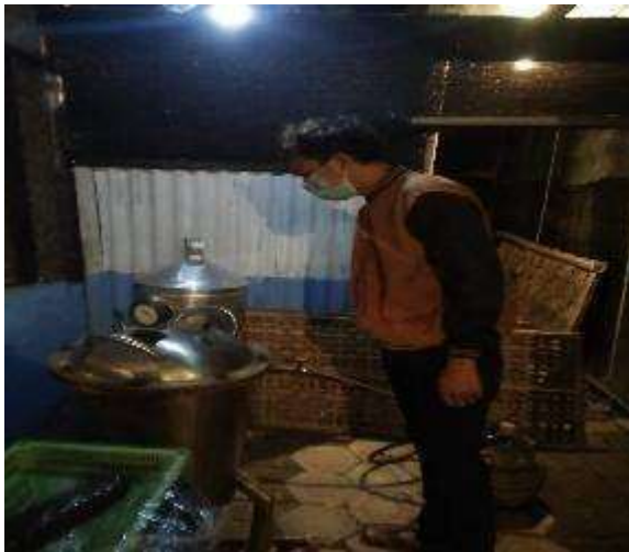
Gambar 22. Proses Pembuatan Krupuk

Awalnya kami bersosialisasi dengan owner jamur tiram dengan memberi inovasi produk baru olahan makanan berbahan dasar jamur tiram. Setelah itu owner menerima ide tersebut dan kami langsung mempraktikanya bersama owner. Pertama kami membuat olahan nugget jamur dari olahan tersebut kami mengalami kendala yaitu tidak bisa membuat dengan jumlah banyak dan dari penyimpanan nugget karena harus disimpan difrezzer.kemudian di minggu berikutnya kami membuat krupuk dari olahan jamur tiram dari olahan ini kami berhasil dan langsung memproduksi banyak,keunggulan dari membuat produk krupuk jamur tiram ini yaitu jangka waktu kadaluarsanya panjang bisa berbulan-bulan dan mudah tempat penyimpanannya sekaligus mengatasi jamur yang tidak laku terjual tidak membusuk dan terbuang dengan sia-sia.