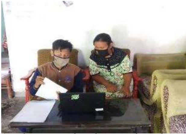
Gambar 15. Pemberian pengetahuan dan pengarahan Pada orang tua