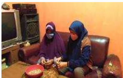
Gambar 26. Foto pendampingan UMKM