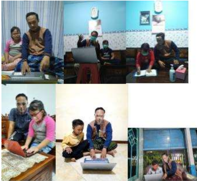
Gambar 21. Pendampingan belajar online