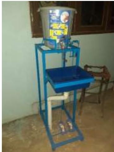
Gambar 13. Hasil Pembuatan Tempat Cuci Tangan Sistem Injak

Tempat cuci tangan dengan system Injak sebagai tempat cuci tangan tanpa menyentuh kran dan tersedia sabun untuk cuci tangan , dengan adanya tempat cuci tangan dengan inovasi baru dan mudah digunakan untuk masyarakat umum maka masyarakat bisa tertarik untuk cuci tangan sebelum masuk mushollah karena cuci tangannya dengan cara unik dan satu-satunya yang ada di desa plosa dan juga bermanfaat untuk menjaga kebersihan agar bisa memutus rantai penularan virus covid-19 dan termasuk memenuhi peraturan protokol kesehatan covid-19 ketika masuk masjid atau mushollah.