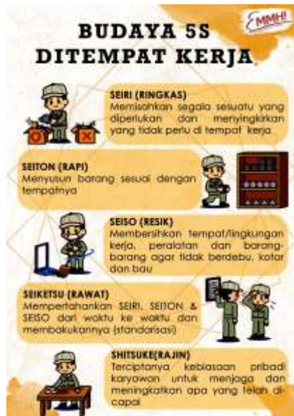
Gambar 6. Poster Budaya 5S / 5R

Menurut Rantung (2018), penerapan budaya 5R akan berpengaruh untuk meningkatkan efisiensi dan kualitas di tempat kerja. Budaya 5R sendiri merupakan suatu cara atau metode untuk mengatur, mengelola tempat kerja yang lebih baik dan secara berkelanjutan.