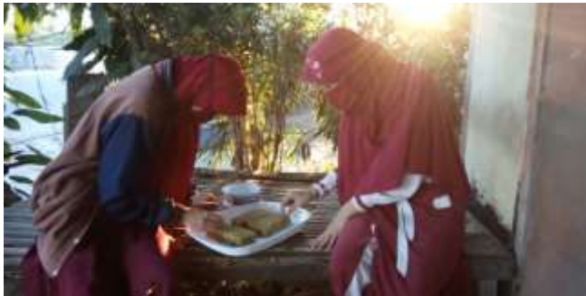
Gambar 12 Penyemaian benih tanaman sawi

Dalam program ini, kita memulai dengan kegiatan penyemaian bibit sayur, membuat media tanam, menyiram tanaman setiap pagi dan sore, memberi pupuk dua minggu sekali, dan lain-lain. Adanya kegiatan ini membuat masyarakat semakin senang untuk bercocok tanam. Mulai dari menanam bibit cabai, tomat, jeruk dan lain sebagainya. Kegiatan ini dilakukan oleh Hilyatul Auliya.