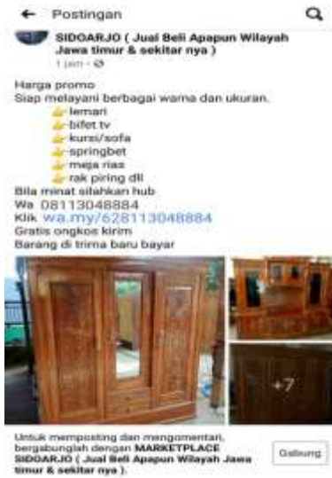
Gambar 10. Pemasaran mebel lewat facebook