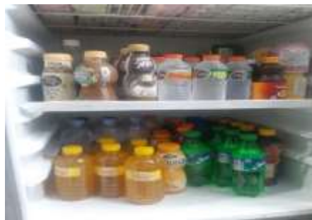
Gambar 11. Pemasaran sinom lewat offline