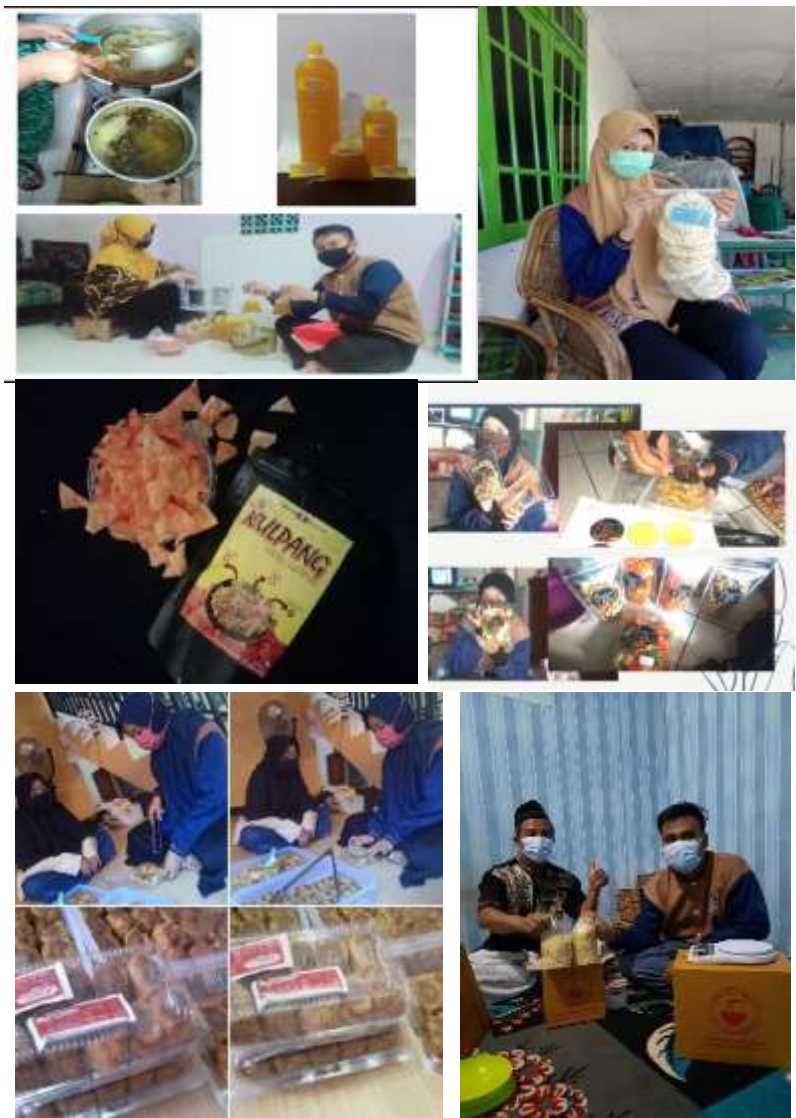
Gambar 7 Hasil pengemasan dan branding beberapa produk UMKM sasaran (kerupuk puli, sinom kulit pangsit, camilan, tahu bakso, mi)