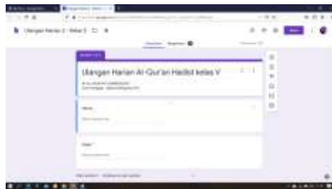
Gambar 3. Pembuatan Media Evaluasi Belajar

Media belajar adalah suatu yang sangat dibutuhkan dimasa pandemi COVID ini, sehingga media pembelajaran secara online sangat dibutuhkan oleh para siswa untuk mendapatkan materi secara tidak langsung. Maka disini dibuatlah media pembelajaran berupa vidio, kuis, evaluasi dan lain-lain, supaya belajar mengajar tetap berjalan lancar guru di paksa untuk kreatif dalam memberikan materi secara online, kami membuat sebuah video yang dapat mebuat lajar dapat lebih mudah dipahami oleh siswa, dan selain video kami juga membuat kuis untuk mengasah ngasah otak para siswa agar dapat saling berinteraksi, selain kuis dan video juga membuat media evaluasi untuk mengukur sebarapa faham yang di tangkap oleh murid selama belajar di rumah secara online. Kegiatan ini dilakukan oleh Nurul Hidayah.