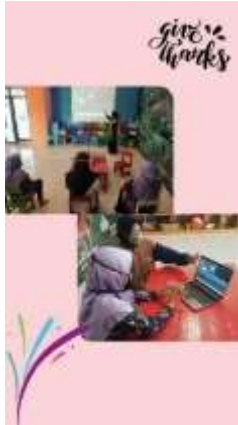
Gambar 1. Melatih guru membuat foto dan video menggunakan ms. Power point

Selain melatih guru-guru, kami juga melatih siswa nya yang belum tau cara belajar lewat daring dan kami juga mengajari mereka membaca dan menulis yang materinya dari internet google atau youtube atau disebut luring. media pembelajaran luring , yaitu televisi, radio, modul belajar dan lembar kerja, bahan ajar cetak, serta alat peraga dan media belajar dari benda dan lingkungan sekitar. Kegiatan ini dilakukan oleh Hasya Syabilah dan Yuyun Chamidah.