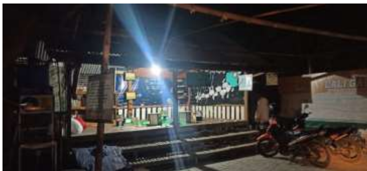
Gambar 4. Gubuk Kampung Lali Gadget

Gubuk baca Kampung Lali Gadget ini terletak di halaman rumah Founder Kampung Lali Gadget yaitu Kak Irfandi yang menurut kami masih kurang luas dan megah, oleh karena itu saya Bersama kak irfandi dan pengurus Kampung Lali Gadget, serta para warga sekitar akan membuat gubuk baru yang lebih luas dan megah, yang akan diletakkan di Kebon Gayam belakang Kampung Lali Gadget, Gubuk baca ini rencananya akan dilengkapi dengan caffe yang diberi nama caffe KLG, dan dilengkapi stan jajanan makanan tradisional, serta halaman yang luas untuk digunakan anak-anak bermain, disini saya membantu baik tenaga maupun beberapa material untuk berlangsungnya pembangunan gubuk tersebut. Kegiatan ini dilakukan oleh Triansyah.