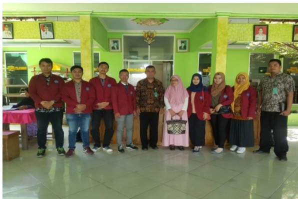
Dok.2 Kegiatan Survei di Balai Desa Tebel

Surve Tempat Lokasi Pengabdian Masyarakat di Desa Tebel dengan DPL bertujuan untuk mengetahui Lokasi mahasiswa nanti waktu melakukan kegiatan Pengabdian Masyarakat. Berada di Kantor Kelurahan Desa Tebel dan di hadiri oleh Perangkat Desa sehingga kita nantinya ketika melakukan pemberangkatan kita mengerti arah dan tujuannya.