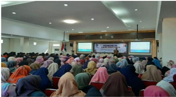
Dok.1 Pembekalan Di UMSIDA

Pembekalan kegiatan Pengabdian Masyarakat, Penyerahan buku panduan dan Pertemuan dengan DPL kegiatan ini dilakukan agar mahasiswa mengerti akan kegiatan-kegiatan yang harus di laksanakan saat Pengabdian Masyarakat.