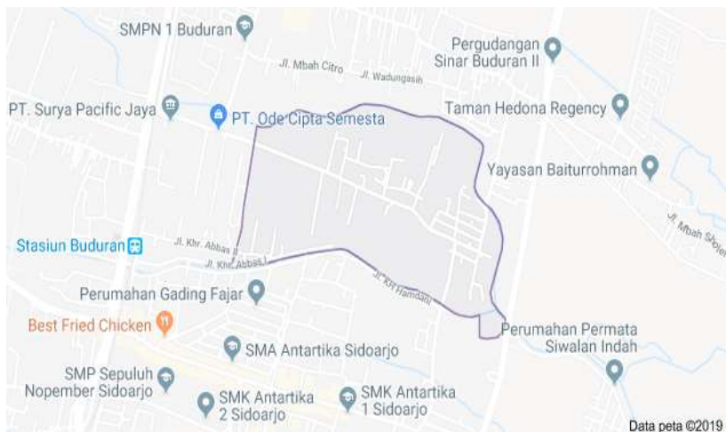
Gambar. 1 Peta Desa Sidomulyo Kecamatan Buduran Sidoarjo

Secara geografis Desa Sidomulyo merupakan desa yang diapit dua aliran sungai yang terletak dibagian utara dan selatan . Desa Sidomulyo merupakan desa yang berbatasan langsung dengan desa lain yaitu: sebelah Utara terdapat Desa Wadungasih, sebelah Selatan adalah Desa Siwalanpanji, sebelah Barat ada Desa Buduran, dan sebelah Timur terdapat Desa Prasung.