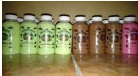
Gambar 3 Do Milk

Do milk merupakan output atau luaran dari adanya program pelatihan kepada ibu ibu PKK. Segmentasi pasar dari produk ini adalah kalangan remaja. Dengan harga pokok penjualan (HPP) yang terjangkau sebesar Rp 6.000 diharapkan pasar dapat menerima produk ini dan memiliki peminat tersendiri. Produk Do Milk ini mempunyai beberapa varian rasa yaitu rasa melon, coklat, strowbery. Bahan bahan yang digunakan dalam produk Do milk ini terdiri dari bahan bahan yang aman dikonsumsi dengan bahan utamanya adalah susu segar selain itu bahan lain yang digunakan adalah nutrijel dan menggunakan gula asli. Produk Do Milk ini tidak menggunakan bahan pengawet sehingga jangka pemakaiannya tidak bertahan lama yakni bisa tahan hingga dua minggu apabila disimpan di lemari pendingin dan apabila tidak disimpan di lemari pendingin hanya bertahan hingga satu minggu. Dalam mengkonsumsinya produk ini cocok dikonsumsi saat dingin. Dalam proses pembuatannya dapat dilakukan dengan mudah mudah sehingga ibu ibu PKK yang ada di Desa Sidomulyo dapat membuatnya dengan mempraktikkannya di rumah. Pemasaran produk ini adalah melalui media sosial dan melalui jalinan relasi.