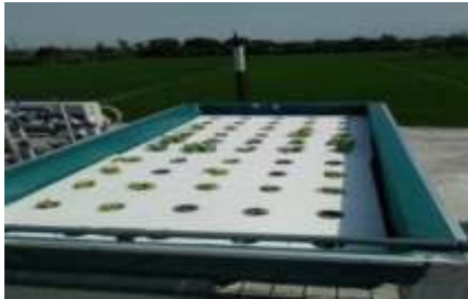
Gambar. 2. Rancang Bangun Hidroponik Rakit Apung

Meskipun terdapat kelebihan tetapi disisi lain rancang bangun ini masih terdapat kekurangan yaitu kekurangan menggunakan rancang bangun ini adalah proses tanam tumbuhan menggunakan rancang bangun ini yang lama sehingga apabila menginginkan masa panen yang cepat maka tidak bisa menggunakan rancang bangun apung ini. Jangka waktu penanaman menggunakan media ini adalah kurang lebih memakan waktu kurang lebih tiga puluh lima hari. Meskipun memakan jangka waktu yang lama tetapi volume tumbuhan yang dapat ditanam pada media ini bisa dikatakan cukup banyak. Untuk satu rancang bangun hidroponik ini dapat ditanami tumbuhan sebanyak lima puluh lima tumbuhan.