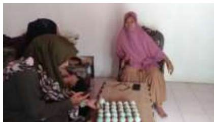
Gambar 2.7 Pendampingan UMKM Telur Asin

Tahap akhir yang kami lakukan adalah editing foto dan font caption agar tampilan lebih menarik.