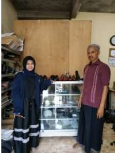
Gambar 2.8 Pendampingan UMKM Sepatu