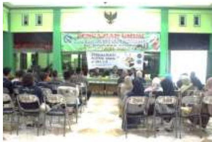
Gambar 2.4 Sosialisasi Potensi UMKM di Era 4.0

Tahap akhir yang kami lakukan adalah evaluasi. Dari kegiatan sosialisasi potensi UMKM yang kami laksanakan, respon warga sangatlah antusias.