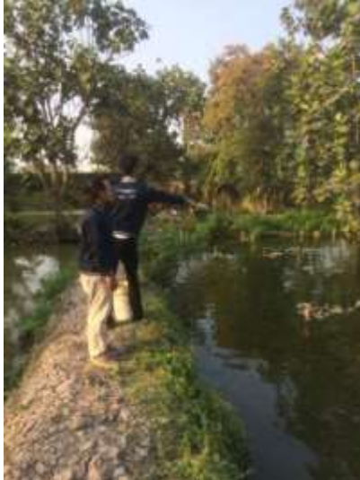
Gambar 2.8 Pendampingan usaha perikanan