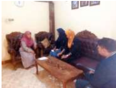
Gambar 1.1 Kegiatan Door to door ke pelaku usaha desa Banjarsari

Berdasarkan kegiatan door to door tersebut, permasalahan yang kami jumpai adalah sistem pemasaran pelaku usaha yang masih konvensional dan keterbatasan promosi. Strategi pemasaran mereka masih terbatas dengan direct selling yaitu bentuk penjualan langsung yang dilakukan dengan cara tatap muka kepada konsumen. Sistem pemasaran seperti ini perlu adanya upgrade untuk menghadapi era Industri 4.0 dengan mengoptimalkan penggunaan teknologi digital.