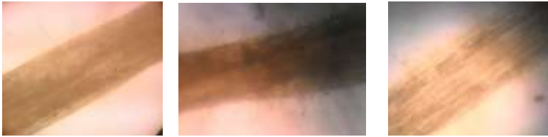
Gambar 2. Kondisi akar kedele tanpa infeksi mikoriza (NOM0) dan bermikoriza (NOM1 dan NiM1)