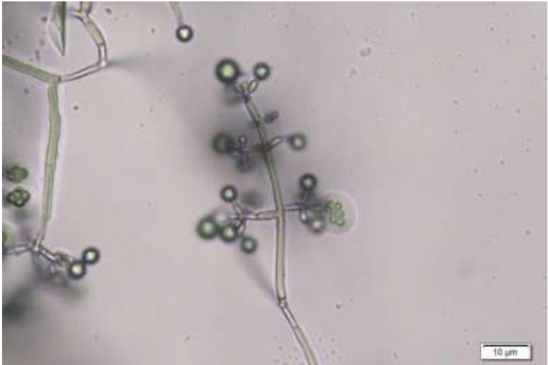
Gambar 2. Trichoderma harzianum isolat Tc-Jjr-02 koleksi Laboratorium Mikrobiologi Fakultas Pertanian Universitas Muhamamdiyah Sidoarjo.

Tahap pertama dilakukan perbanyakan isolat dengan cara menempatkan cuplikan biakan berdiameter 5 mm pada media PDA-m (Vargas Gil, Pastorb, dan Marcha, 2009), kemudian diinkubasi selama 1 minggu. Biakan yang diperoleh diformulasi dalam kompos steril yang komposisi nutrisinya tertera pada Lampiran 1. Tiap satu cawan biakan dapat dicampur dengan 5 kg kompos. Selanjutnya campuran tersebut diinkubasi selama dua minggu sehingga dapat berstatus sebagai biofertilizer yang akan digunakan untuk tahap percobaan selanjutnya. Pada akhir periode inkubasi tersebut dihitung populasi isolat per gramnya.