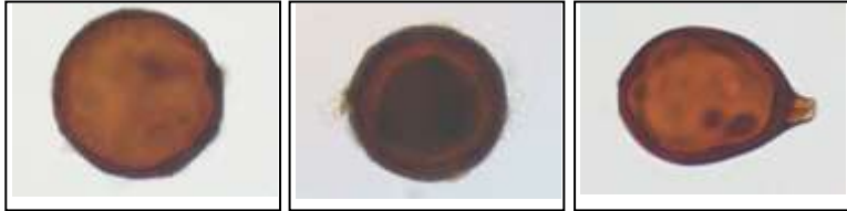
Gambar 3. Spora endomikoriza hasil isolasi yaitu Glomus coronatum , Glomus sp. 1, dan Glomus sp. 2.

Untuk selanjutnya jenis yang digunakan adalah Glomus coronatum untuk uji aplikasi biofertilizer . Setelah dilakukan perbanyakan pada tanaman jagung lokal, diperoleh populasi rata-rata 68 spora per gram tanah. Selanjutnya digunakan sebagai biofertilizer endomikoriza yang diaplikasikan [pada tanaman kedele dalam percobaan ini.